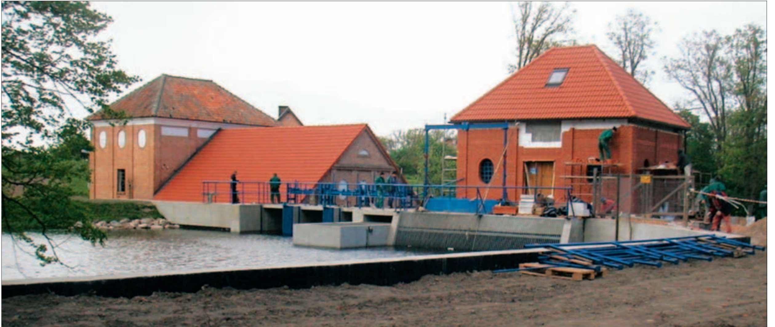
NY KRAFTSTASJON: I dag er det bygd et nytt kraftverk på motsatt elvebredd av den gamle. I den gamle bygningen er det spede planer om at lokale krefter kan få i gang hotell drift og et spisested.

POLSK SELSKAP: Han stiftet selskapet Mewos i Polen for å bygge opp kraftverket. Selskapet har samme eiere som i Techmat. Mewos står for Mala Elektrownia Wodna Olownik, som betyr: Lite vannkraftverk i Olownik.